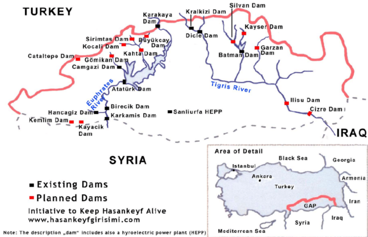
2. számú térkép: A GAP keretében megépülő gátak és vízerőművek 17

Törökország a kritikákra azzal válaszol, hogy mindig is szem előtt tartotta az alvízi államok szükségleteit, még a száraz időszakokban is. Ankarában gyakran hozzák fel példaként a Tigris folyó legnagyobb duzzasztógátját, az Ilisu gátat, melynek feltöltését Törökország iraki kérésre háromszor is elhalasztotta: azt az eredetileg tervezett 2018. március helyett csak 2019 júliusában kezdték el. A 11 milliárd köbméter tárolókapacitású és 1 200 megawatt vízenergia előállítására képes, 2 milliárd dollár költségű Ilisu gátat 2021 novemberében avatták fel. 18 Ankara emellett azzal érvel, hogy a törökországi gátak építése az alvízi államoknak is hasznára válik, mivel lehetővé teszi a vízhozam-ingadozások szabályozását. 19 A török fél a globális klímaváltozás mellett a helyieket tekinti felelősnek az országaikban kialakult vízhiányért, elsődleges okként a rossz vízgazdálkodást nevezve meg, valamint kiemeli az elmaradt infrastruktúra-fejlesztéseket, illetve