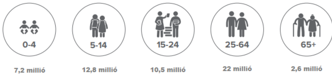
1. ábra A belső menekültek száma életkoruk alapján 2020-ban

A belső migráció hatásai tovább gyűrűznek és az élet megannyi szegmensét érintik. 2020-ban a belső menekültek közel 40%-a munkavállaló korú volt. A megélhetés elvesztése negatívan hat az egészségre és a lakhatási körülményekre, valamint korlátozhatja az alapvető szükségletekhez való hozzájutást – például az oktatáshoz való hozzáférés hiánya teljes generációk életét pecsételi meg. 2020-ban a szubszaharai Afrikában a belső menekülteként számon tartottak 65 %-a gyermek volt. 3